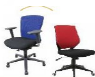
オフィスチェア ¥ 500~