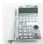
ビジネスフォン ¥ 5,000~/6