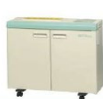
シュレッダー ¥ 3,000

中古品はもちろん、各種メーカーの新品も格安価格でご提供が可能です。設置工事、耐震施工、通信工事、内装・間仕切り工事も承ります。